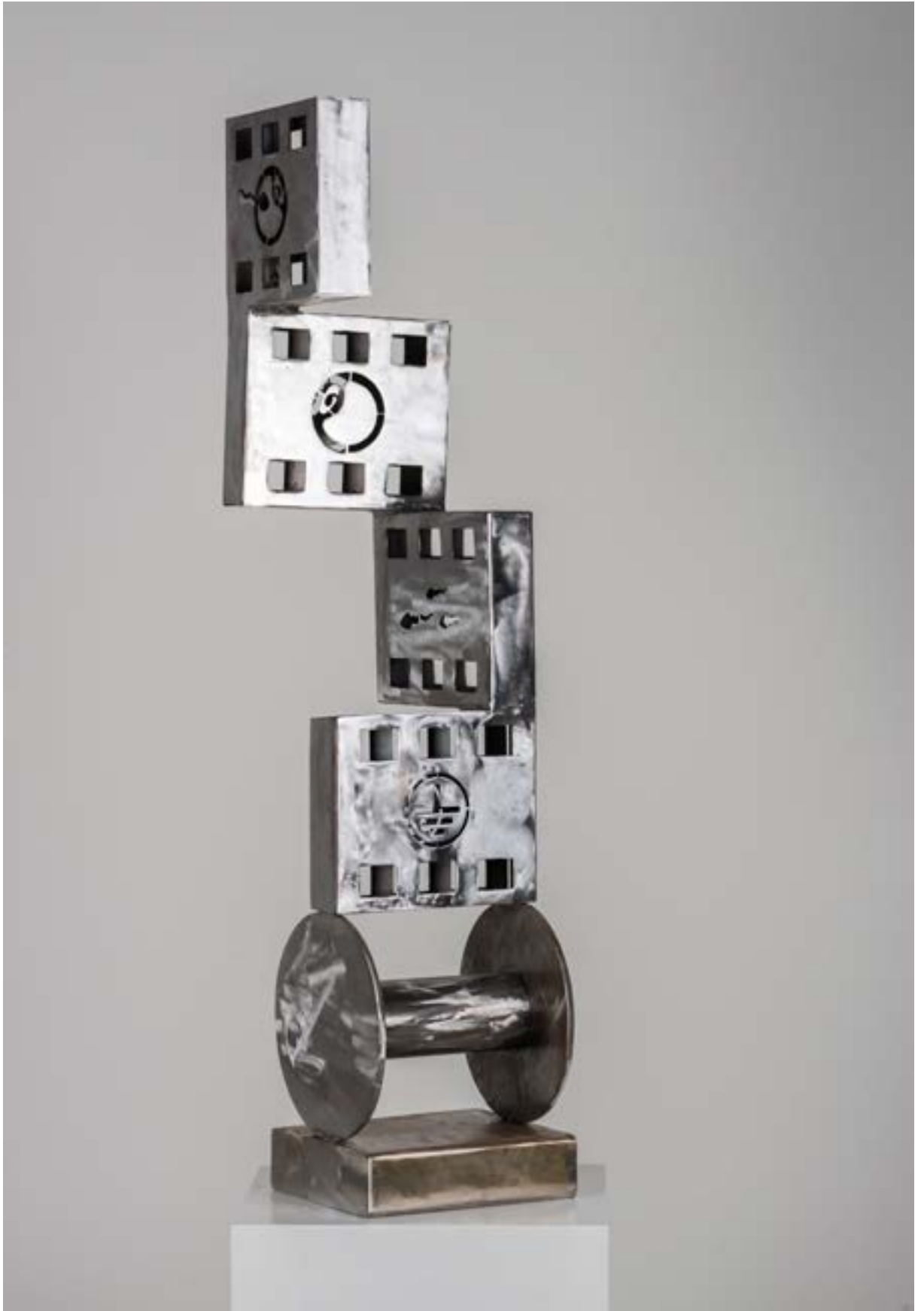
İsimsiz, 23x30x105,5 cm, Metal- Lazer kesim ve kaynak tekniđi, 2014 Untitled, 23x30x105,5 cm, Metal - Laser cutting and welding techniques, 2014