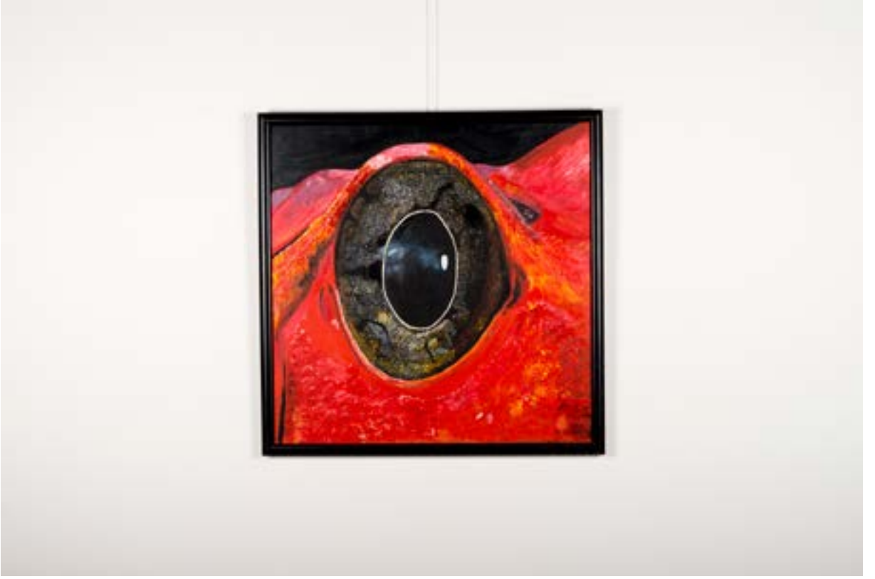
Organiz Çalışma, 80x80 cm, Tuval üzerine Akrilik Organic Work, 80x80 cm, Acrylic on Canvas