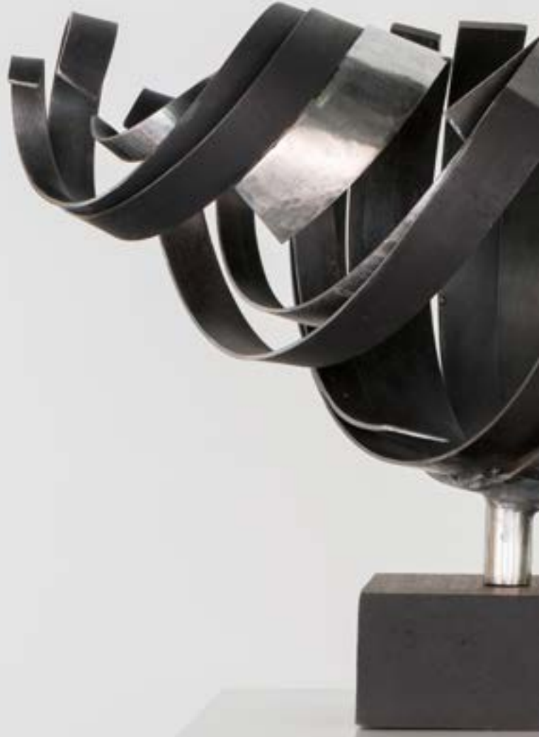
Tümevarım, 62x35x45 cm, Metal şekillendirme, 2014 Induction, 62x35x45 cm, Metal shaping, 2014