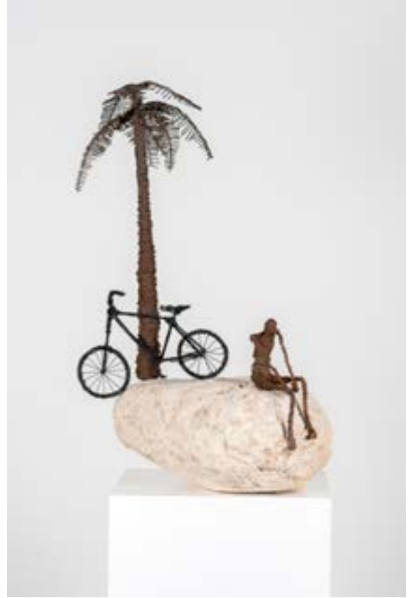
İsimsiz, 76x45x30 cm, Metal tel - Dođal tař Boya, 2014 Untitled, 76x45x30 cm, Metal wire - Natural stone Paint, 2014