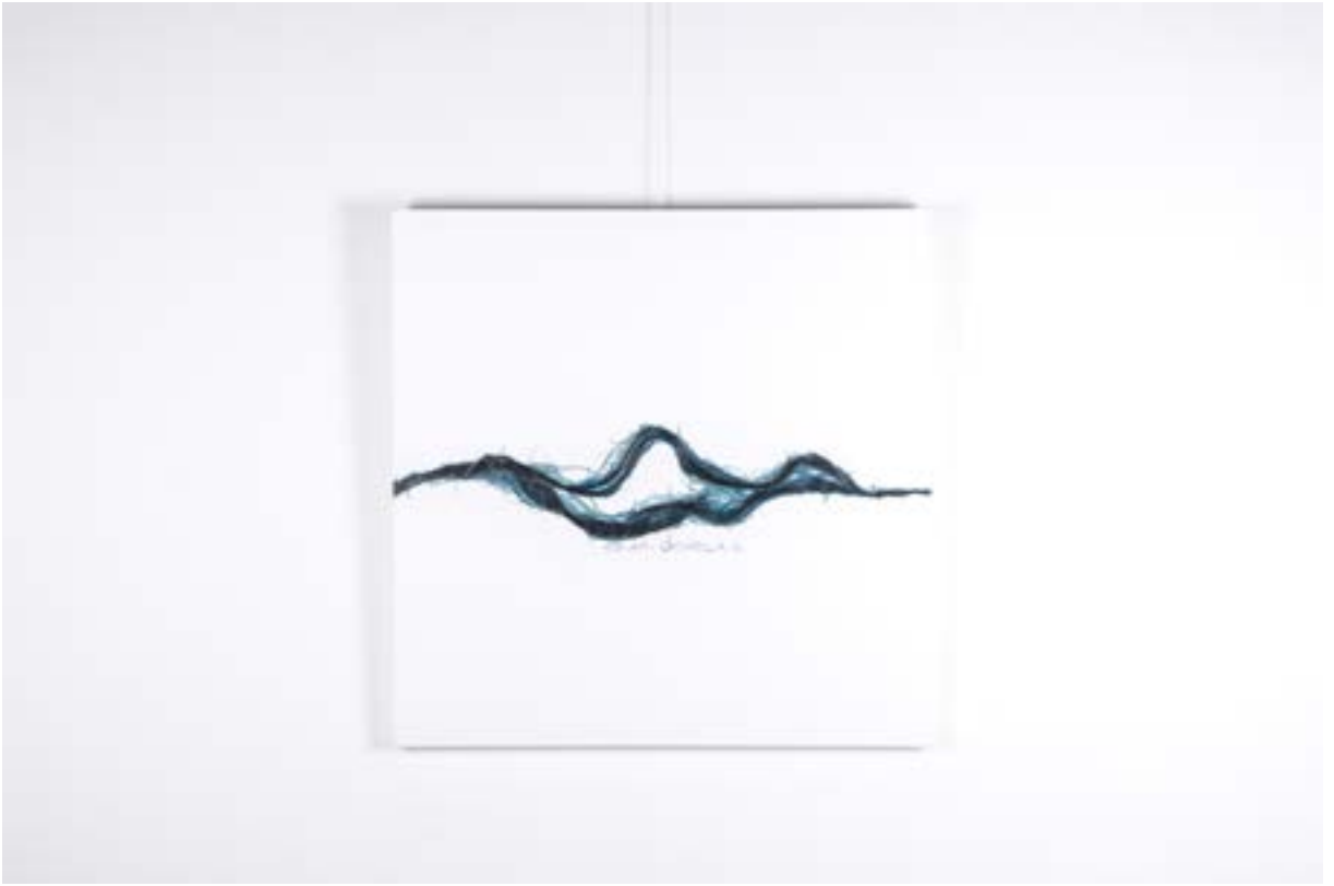
Neuronal Cell, 90x90 cm, Tuval üzerine karışık teknik, 2014 Neuronal Cell, 90x90 cm, Mixed technique on canvas, 2014