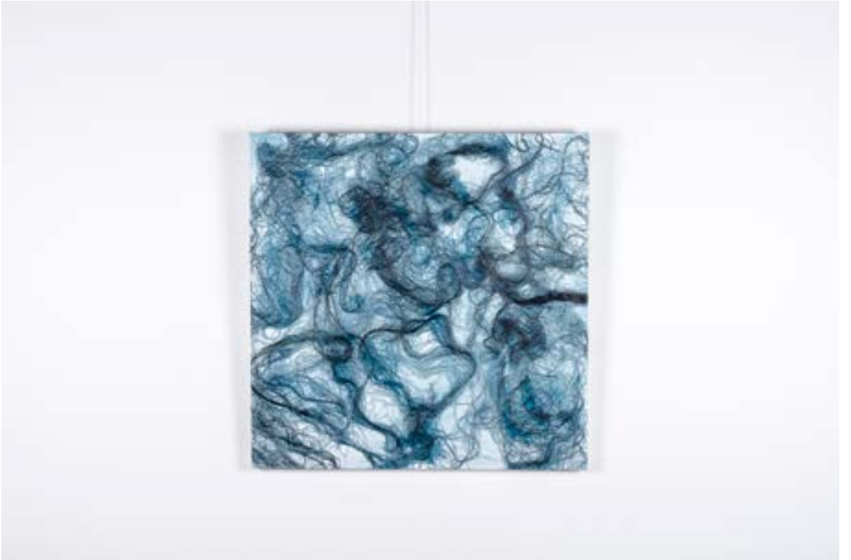
Tissue, 70x70 cm, Tuval üzerine kaşık teknik, 2014 Tissue, 70x70 cm, Mixed technique on canvas, 2014