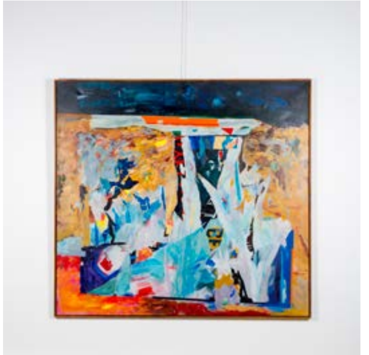
Billboard, 150x160 cm, Tuval üzerine akrilik, 2014 Billboard, 150x160 cm, Acrylic on Canvas, 2014