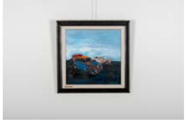
Araba Mezarlığı, 40x40 cm, Tuval üzerine akrilik, 2014 Junkyard, 40x40 cm, Acrylic on Canvas, 2014