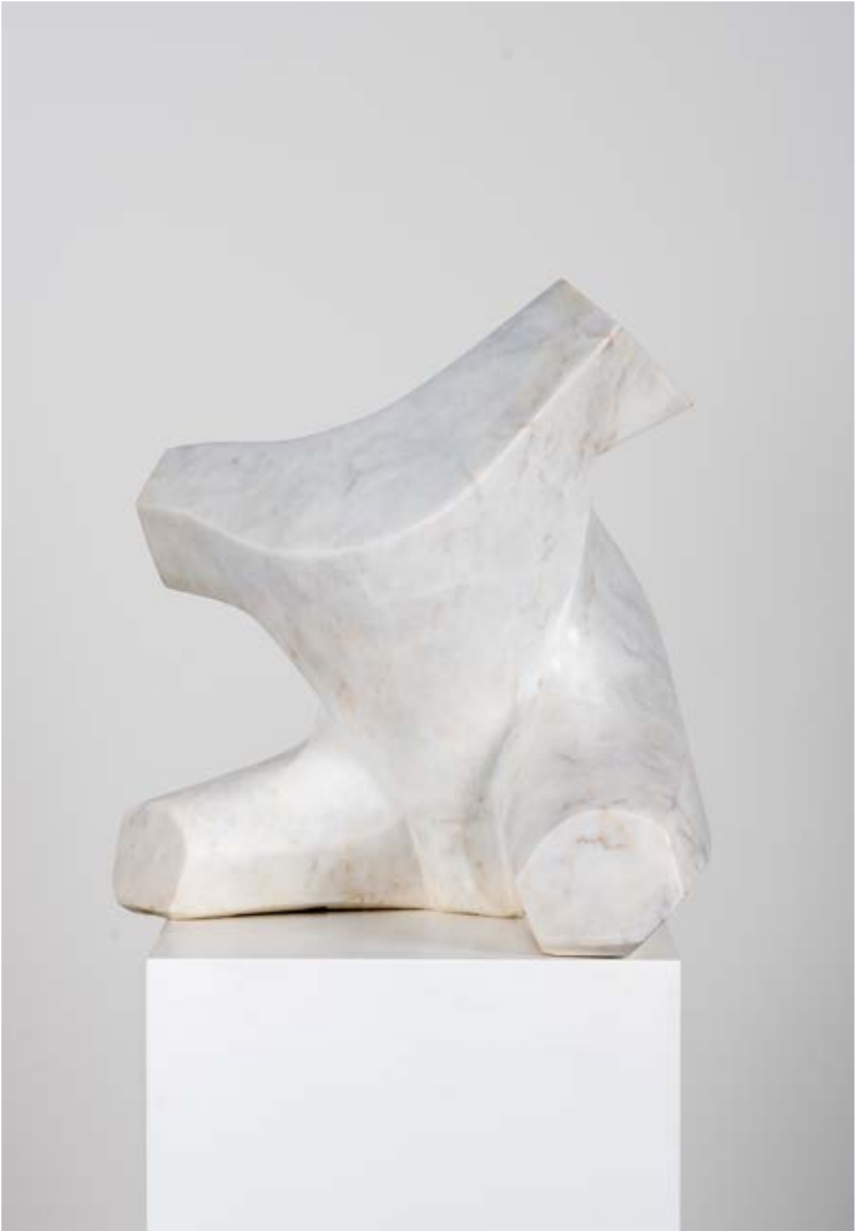
Belvedere, 45x46x34 cm, Mermer - Yontu, 2013 Belvedere, 45x46x34 cm, Marble - Sculpture, 2013