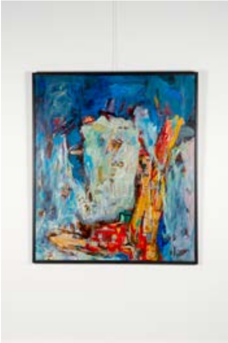
Billboard, 140x120 cm, Tuval üzerine akrilik, 2014 Billboard, 140x120 cm, Acrylic on Canvas, 2014