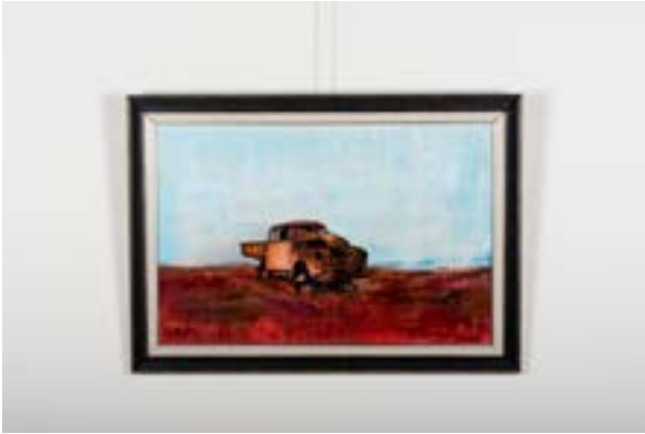
Hurda Kamyon, 50x75 cm, Tuval üzerine akrilik, 2014 Junk Truck, 50x75 cm, Acrylic on Canvas, 2014