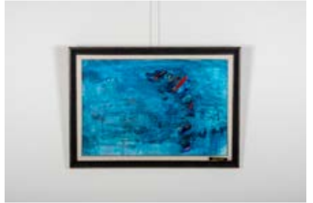
Rüzgarda Kilim, 50x75 cm, Tuval üzerine akrilik, 2014 Rug in the Wind, 50x75 cm, Acrylic on Canvas, 2014