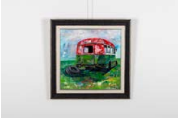
Hurda Otobüs, 40x40 cm, Tuval üzerine akrilik, 2014 Junk Bus, 40x40 cm, Acrylic on Canvas, 2014