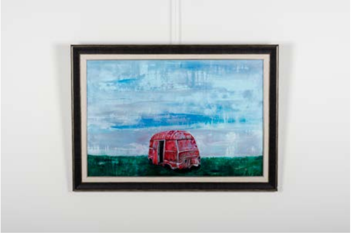
Hurda Otobüs, 50x75 cm, Tuval üzerine akrilik, 2014 Junk Bus, 50x75 cm, Acrylic on Canvas, 2014