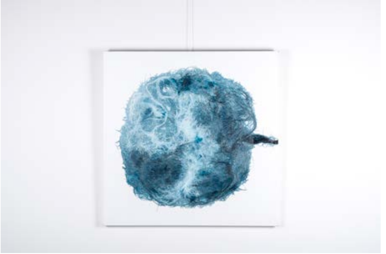
Neuronal Cell, 70x70 cm, Tuval üzerine kaşık teknik, 2014 Neuronal Cell, 70x70 cm, Mixed technique on canvas, 2014