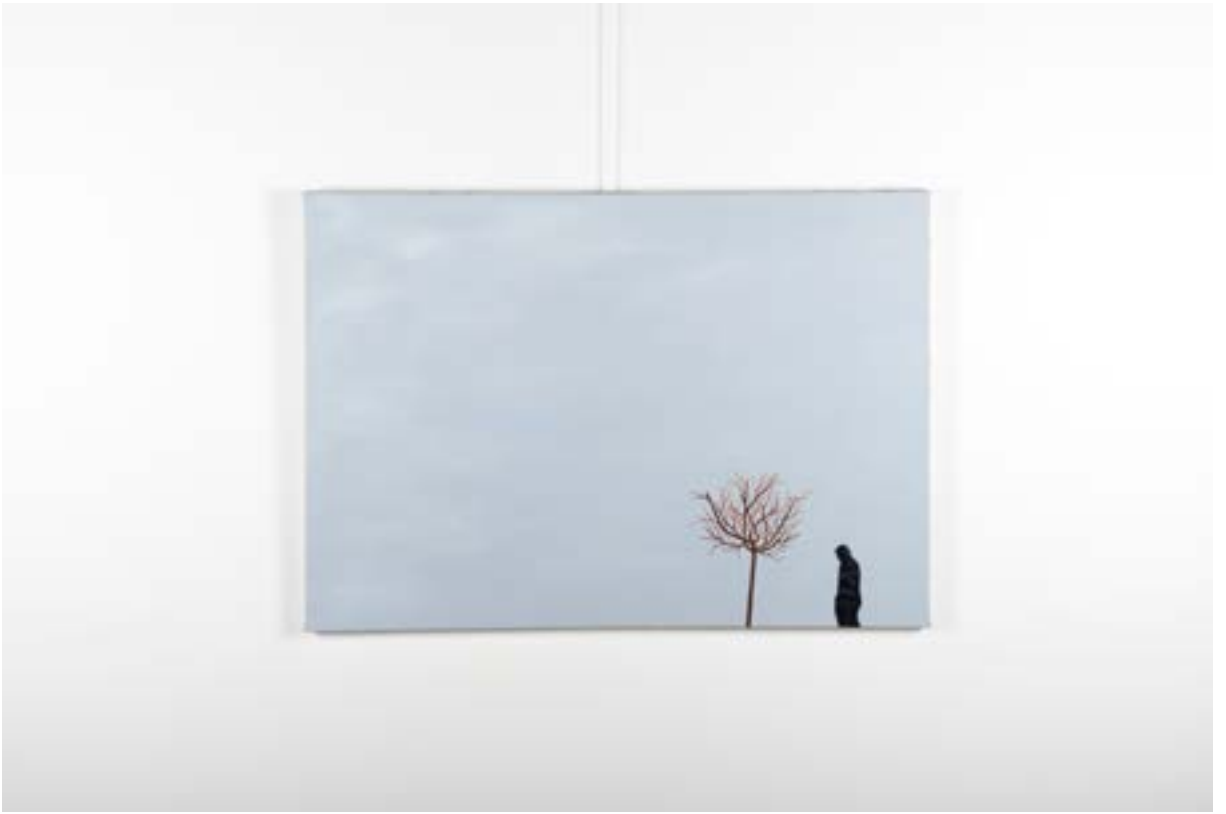
Batı, 80x100 cm, Tuval üzerine kanşık teknik (Kolaj-Asamblaj), 2014 West, 80x100 cm, Mixed technique on Canvas (Collage-Assemblage), 2014