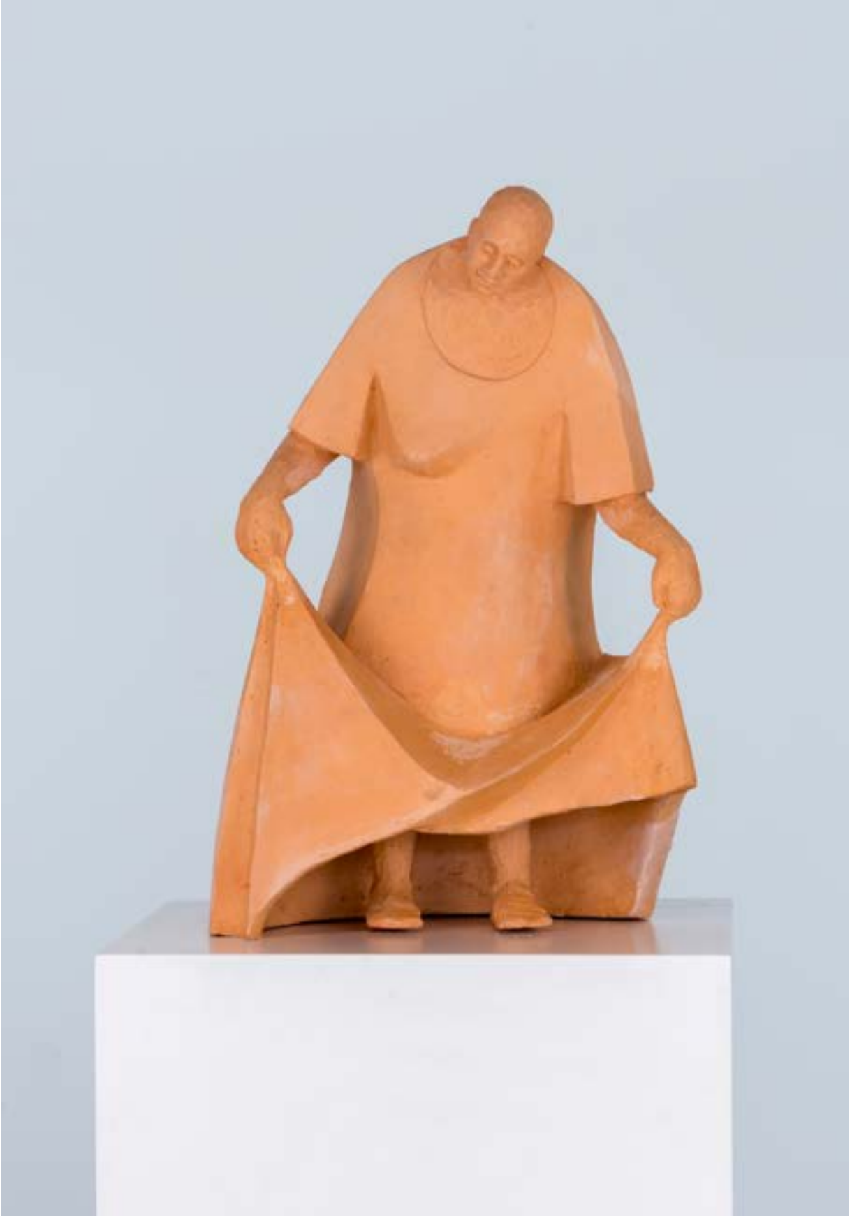
İsimsiz, 29x28x42 cm, Pişmiş toprak, 2014 Untitled, 29x28x42 cm, Terra-Cotta, 2014