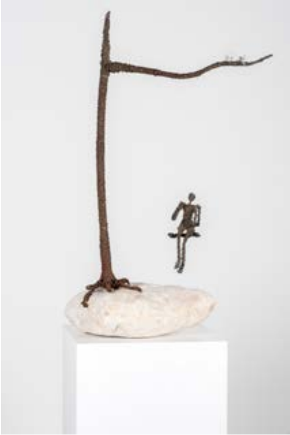
İsimsiz, 76x54x28 cm, Metal tel - Dođal tař Boya - Misina, 2014 Untitled, 76x54x28 cm, Metal wire - Natural stone Paint - Fishline, 2014