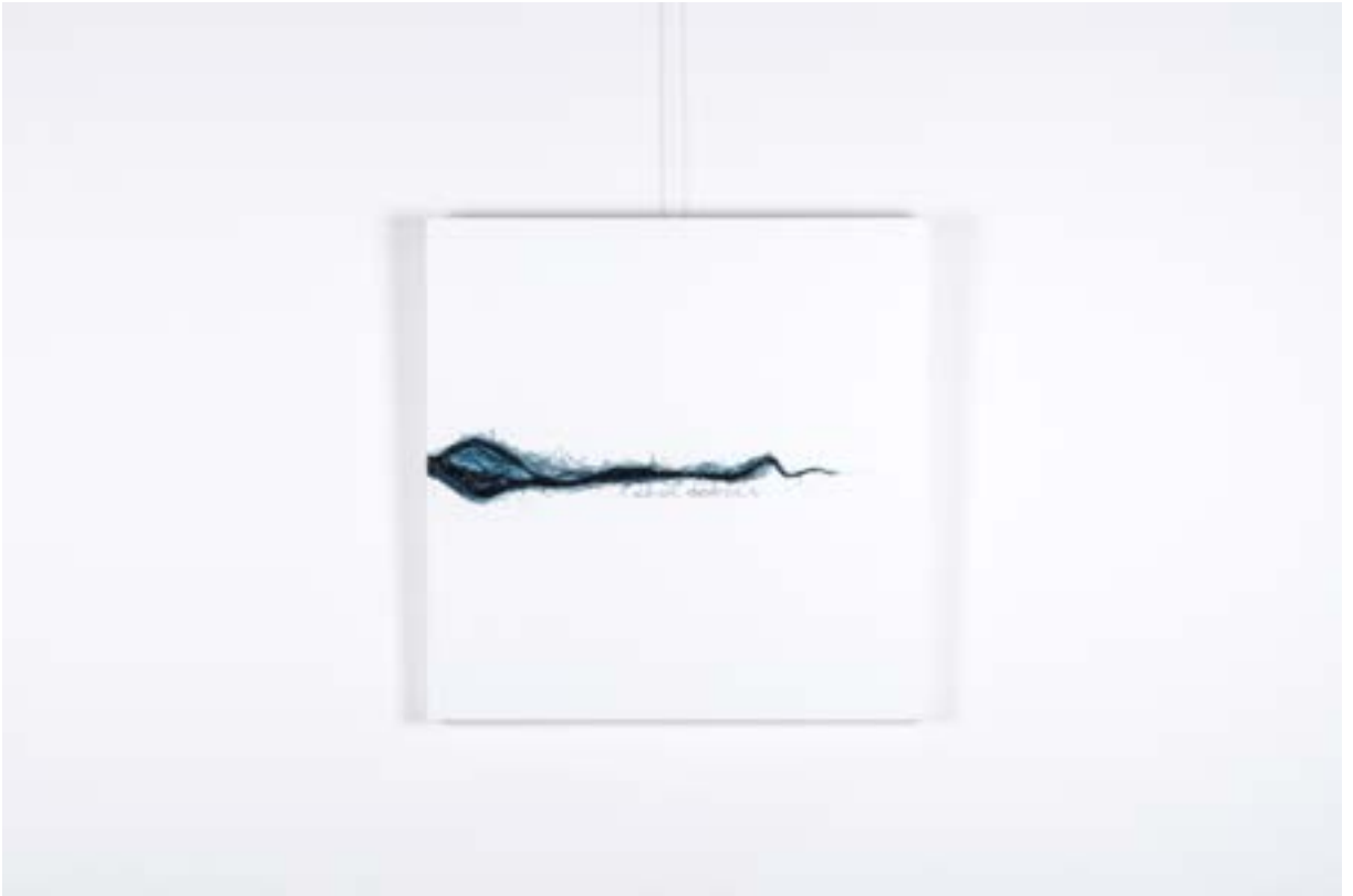
Tissue, 70x70 cm, Tuval üzerine karışık teknik, 2014 Tissue, 70x70 cm, Mixed technique on canvas, 2014