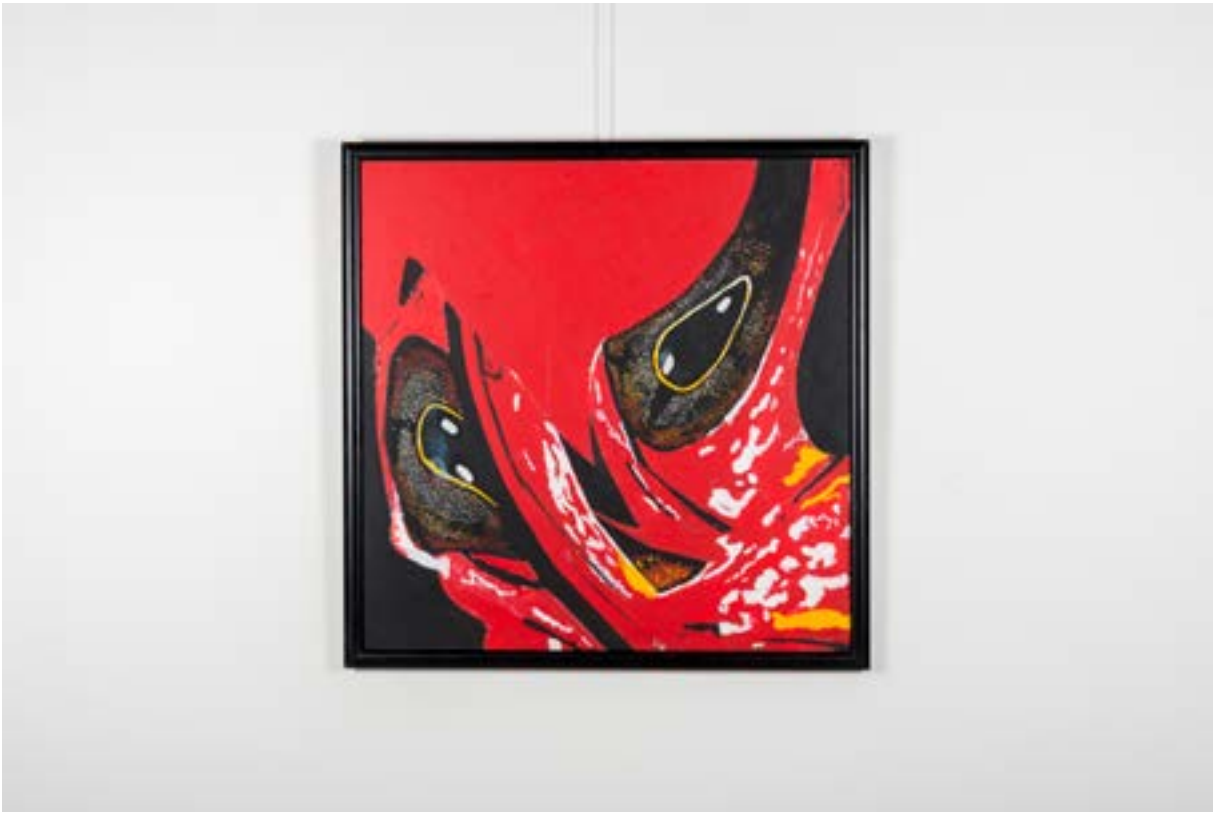
Organiz Çalışma, 80x80 cm, Tuval üzerine Akrilik Organic Work, 80x80 cm, Acrylic on Canvas